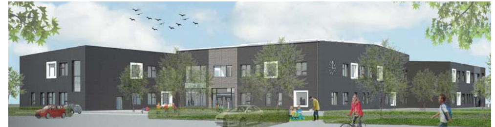
Färdigställandeår: 2019 Byggherre: Fastighetsförvaltningen Yta (BTA): ca 4.500 kvm Byggnadsentreprenör: Skanska Sverige AB

Bygglov har nyligen beviljats för Mariaskolan och projekteringen är i full gång. Skolan kommer att byggas i Mariastaden, stå klar till HT-2019 och då kunna ta emot ca 350 elever och vara utrustad för särskola.