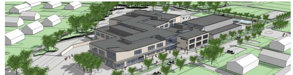
Färdigställandeår: 2021 Byggherre: Höganäs Kommun Yta (BTA): ca 10.000 kvm Byggnadsentreprenör: Byggmästar'n i Skåne

Projekteringen pågår för Vikensskolan, som ska rymma undervisningslokaler samt idrottshall för ca 800 elever i klass F-9