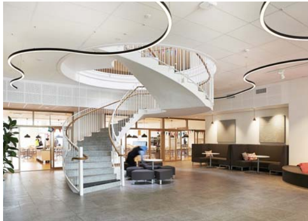
Färdigställandeår: 2017 Yta (BTA): ca 4.970 kvm Byggherre: Fastighetsförvaltningen Byggnadsentreprenör: Skanska Sverige

Korridorer har undvikits och kommunikationsytorna är istället utformade som generösa uppehålls- och studieytor. Ljus och transparens är viktigt, stora glaspartier mellan rummen gör att dagsljuset letar sig in mellan salarna, samtidigt undviker man dolda hörn med sikt och öppna ytor.