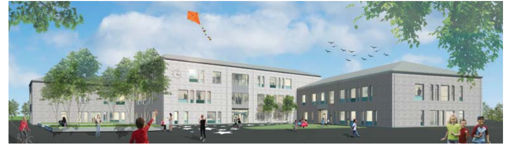
Färdigställandeår: 2018 Byggherre: Fastighetsförvaltningen Yta (BTA): ca 5.900 kvm Byggnadsentreprenör: Skanska Sverige AB

Rydebäcksskolan är den andra av tre stora skolor vi ritat i Helsingborg på kort tid. Bygget pågår för fullt, och HT-2018 ska skolan stå klar att ta emot 550 elever i åk F-9.